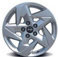
Jantes en alliage de 17 po De série sur la version Essential