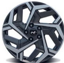
Jantes en alliage de 19 po De série sur les versions N Line et N Line avec ensemble Ultimate