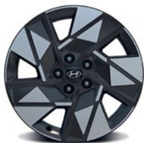
Jantes en alliage de 18 po De série sur la version Preferred et Preferred avec ensemble Trend Preferred model